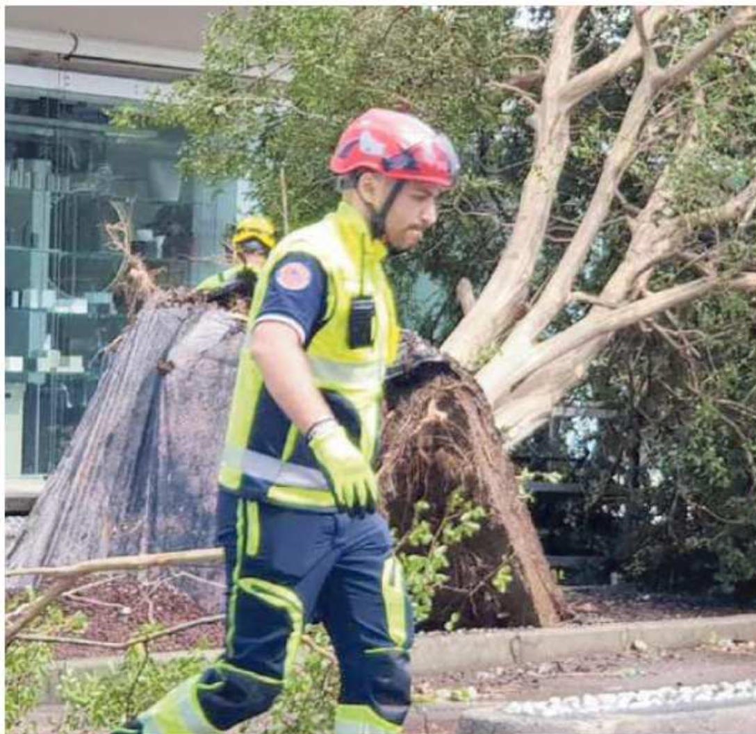
Un soccorritore a Dolo dopo la violenta grandinata della scorsa settimana