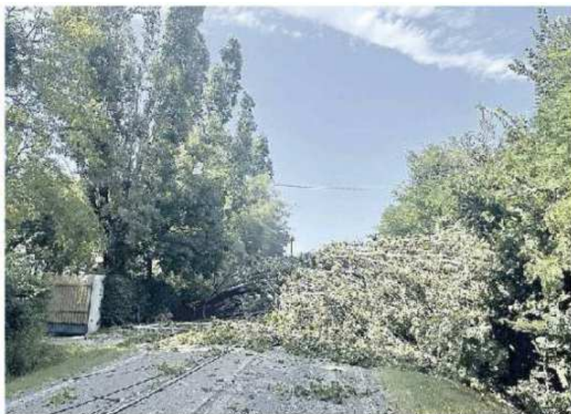
VERDE PUBBLICO DISTRUTTO L'albero caduto sulla sede stradale a Jesolo